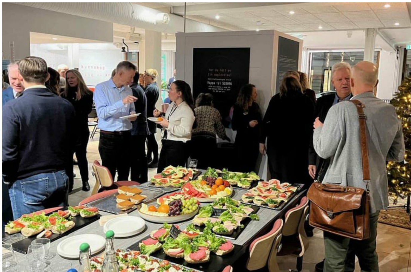
Livlig passiar mellom deltakere på hub-møtet i Kreftforeningens Vitensenter 16. desember

-Kreft er en stor samfunnsutfordring og fryktelig tøft for både den som rammes og de pårørende. Det er viktig at vi satser i felleskap på kreftforskning og det er gledelig at stadig flere overlever sykdommen. Kunnskap som blir skapt i fellesskap har større sannsynlighet for å være relevant og dermed tatt i bruk. Forskningsrådet er derfor stolt medlem av den norske Cancer Mission huben, som nettopp skal sørge for at vi jobber bedre sammen på tvers.